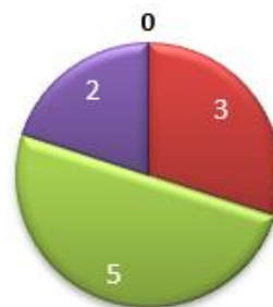
Program studi memperoleh hibah-hibah Dikti dan non Dikti.