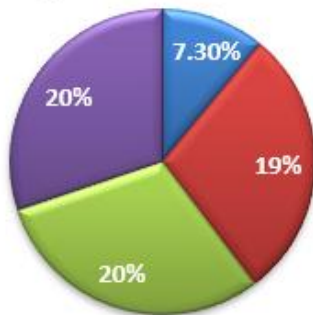
Persentase dosen berpendidikan S3.