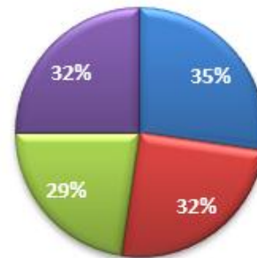
Rasio jumlah dosen tidak tetap terhadap jumlah dosen.